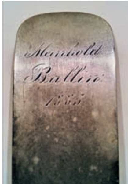
Abb. 3: Silberner Tafellöffel mit der Gravur „Meinhold Ballin 1885“, Heimatmuseum Duderstadt.

Es gibt keine Geber- oder Eingangsdaten zu dem Löffel im Museum, der die Einordnung des Erwerbs stützen könnte. Der Anfangsverdacht liegt unter anderem darin begründet, dass Juden alle Gegenstände aus Edelmetall bis zum 31. März 1939 abliefern mussten, wie eingangs am Beispiel Hamburg erwähnt wurde. Ein verfolgungsbedingter Eingang des Löffels ist demnach nicht auszuschließen.