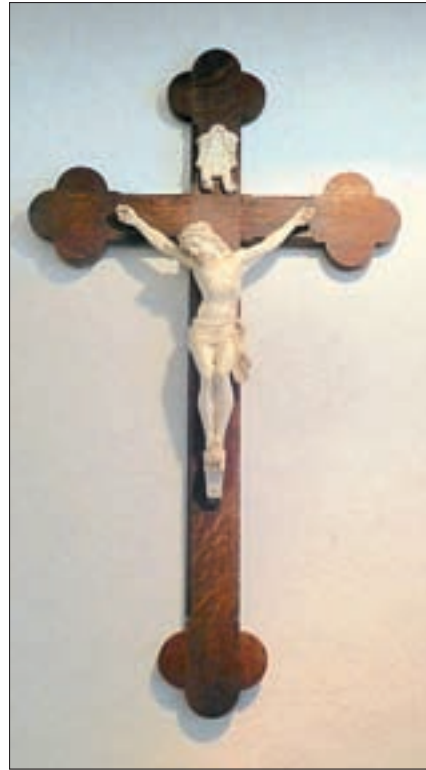
Abb. 5: Kruzifix aus der Mädchen-Oberschule der Duderstädter Ursulinen, Heimatmuseum Duderstadt.

Die Buch-Altbestände im Museum und im Stadtarchiv bergen ebenfalls einige Verdachtsfälle. Es handelt sich dabei um ausgesonderte Bücher aus den vom Borromäus-Verein getragenen Bibliotheken Duderstadt, Westerode und Schöppingen. Wann und unter welchen Umständen diese Bücher aussortiert und vom Museum erworben wurden, ist unbekannt. Verzeichnet wurden einige erst bei der Neuin-