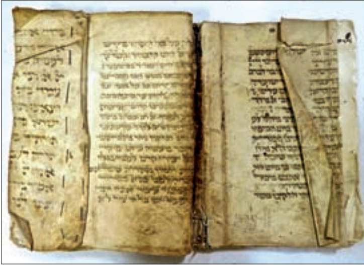
Abb. 2: Fragmente mittelalterlicher jüdischer Gebetbücher (13. Jh.) als Einband des Vogtei-Registers Hilkerode, Stadtarchiv Duderstadt AB 8103.