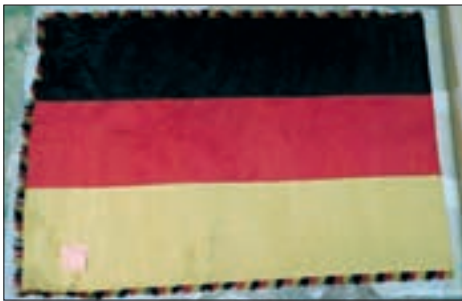
Abb. 9: Republikanische Fahne Schwarz-Rot-Gold im Depot des Heimatmuseums Duderstadt.

und Spinnergeräte für die Webschule wohl direkt von der Landbevölkerung an die Bauernschaft und die RAD-Lager gegeben worden sind. Komplexere Handels- oder Verbringungswege scheiden hier wahrscheinlich aus, sodass die Möglichkeit einer unrechtmäßigen Entziehung relativ gering erscheint.