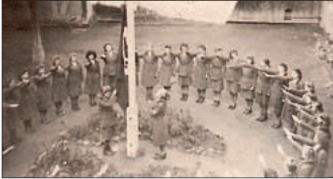
Abb. 8: Fahnenappell der „Arbeitsmädchen“ im Reichsarbeitsdienst-Lager Immingerode, ca. 1936. 28

demonstrieren sie ihr Können im Rahmen von Ausstellungen zu Blut und Sippe, der Nordischen Kultur und zur landwirtschaftlichen „Erzeugungsschlacht“. 29