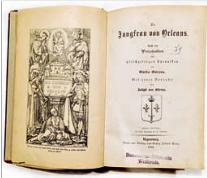
Abb. 6: Religiöses Schrifttum des Borromäus-Vereins Duderstadt, Stadtarchiv Duderstadt.

ventarisierung Anfang der 1980er-Jahre. Manche sind im Museum verblieben, manche wurden in den 1980er-Jahren an das Stadtarchiv abgegeben, wo sie sich bis heute befinden.