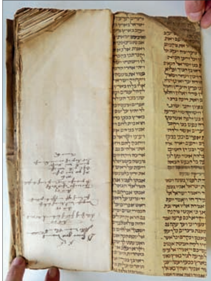
Abb. 1: Fragment einer mittelalterlichen Torahrolle (14. Jh.) als Einband des Duderstädter Brauverzeichnisses, Stadtarchiv Duderstadt: DUD 1 Nr. 3227.

Es gibt allerdings aus der Zeit nach der Einführung des Buchdrucks einige Belege für den Verkauf von Handschriften (außer Torahrollen) durch jüdische Gemeinden, die dann von nichtjüdischen Buchbindern weiterverwendet worden sind. 10 Im Fall der Duderstädter Machsor-Fragmente ist ein unrechtmäßiger Entzug